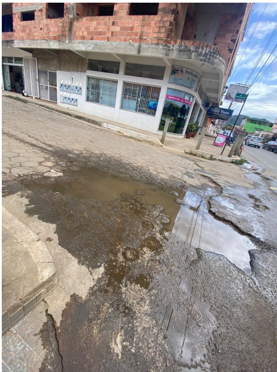
Área de intervenção