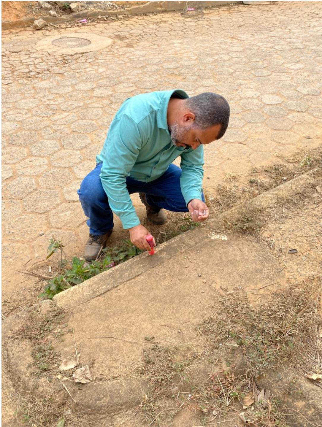
Área de intervenção