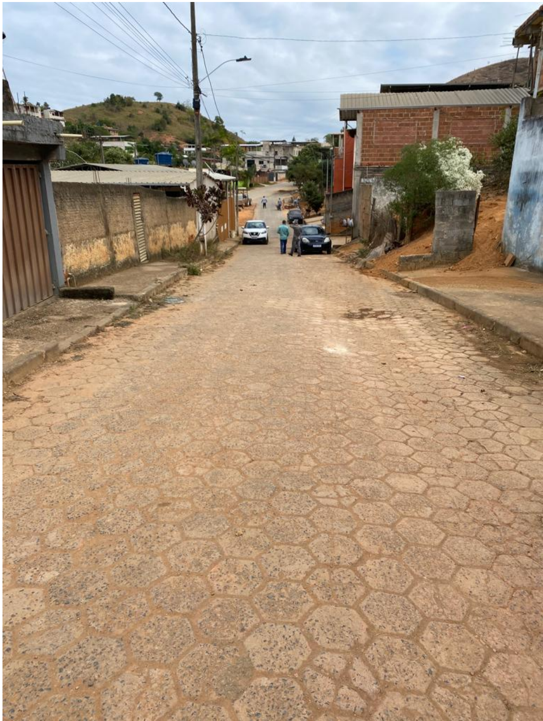
Área de intervenção