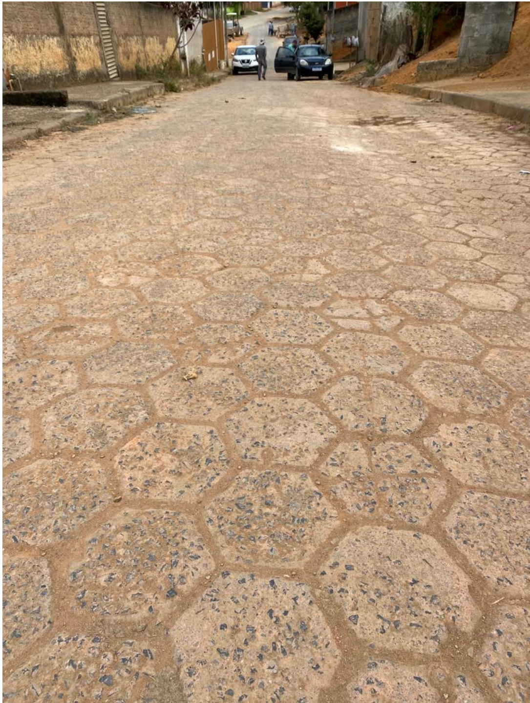
Área de intervenção